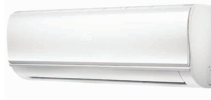
Внутренний блок KSGYK21HZRN1