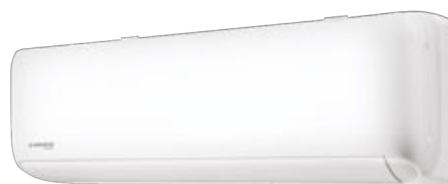
Внутренний блок KSGT150HFAN1