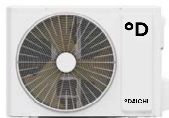
Наружный блок SIB25FVS1R