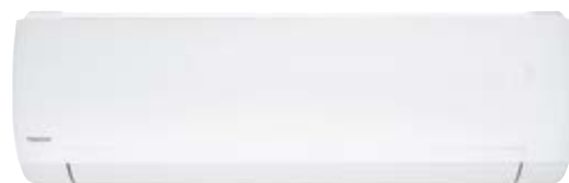
Внутренний блок SIB25AVQS1R