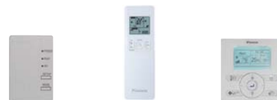
BRP069B41 в комплекте